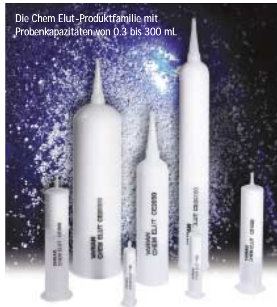
Die Chem Elut-Produktfamilie mit Probenkapazitäten von 0.3 bis 300 mL